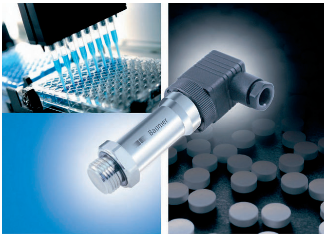
Der Druckmessumformer PBMN von Baumer verfügt über einen Druckanschluss mit frontbündiger Membrane.

Druckmessumformer PBMN von Baumer verfügt über einen Druckanschluss mit frontbündiger Membran. Der Anschluss ist in verschiedenen normierten Dimensionen wie z.B. G 1/2" und G 1" lieferbar. Aufgrund seiner dichtungslosen Konstruktion weist der PBMN eine hohe Medienverträglichkeit auf. Die frontbündige Membran stellt darüber hinaus sicher, dass im Prozess keine Rückstände des zu messenden Mediums im Prozessanschluss zurückbleiben. Damit eignet sich der