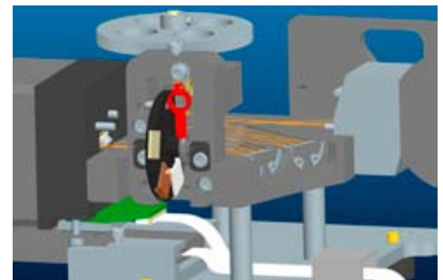
Elliptec Motor X15G (rot) als Antrieb im PLATINblue UV1.

Elliptec Resonant Actuator AG, Nicole Kneppel, Tel.: +49 231 2927 020, E-Mail: info@elliptec.com , www.elliptec.com .