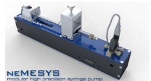
Modulares Präzisions-Spritzenpumpensystem neMESYS.

cetoni GmbH, Ines Pietrek, Tel.: +49 36602 338 12, E-Mail: ines.pietrek@cetoni.de , www.cetoni.de